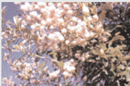
Due particolari della pianta Tarhonianthus camphoratus