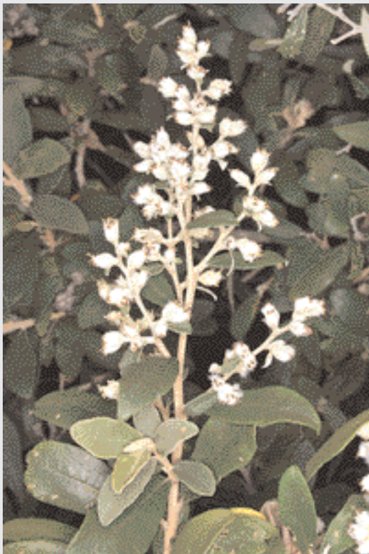
Ramo di Tarchonanthus camphoratus

in cui era stato solubilizzato l'olio essenziale di Tarchonanthus camphoratus per ottenere nel prodotto finale la quantità del 0,12%.